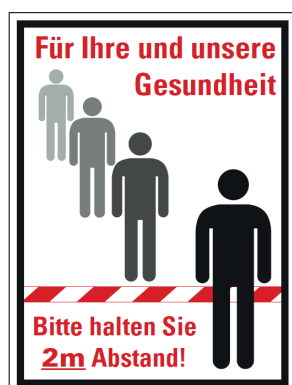
Schild 1 / Panneau 1