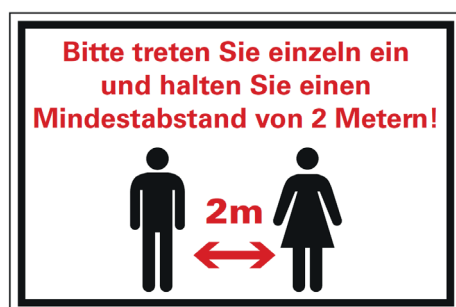
Schild 2 / Panneau 2