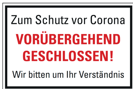
Schild 2 / Panneau 2