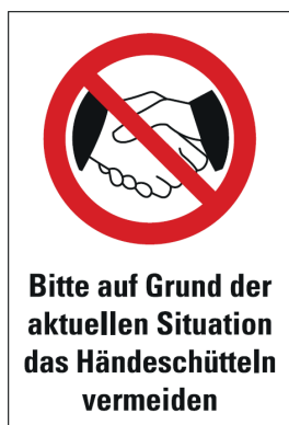
Schild 1 / Panneau 1